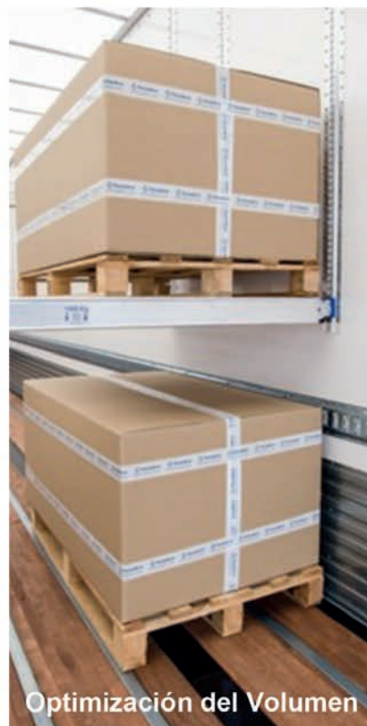
Optimización del Volumen

Fabricantes de Sistemas de Sujeción de Cargas