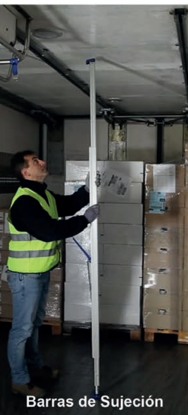
Barras de Sujeción