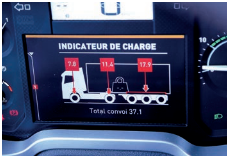
Algunos vehículos incorporan información sobre el peso de la carga por eje, que se muestra en la pantalla del salpicadero.

Las inspecciones se clasifican en dos tipos: inicial y minuciosa. La inicial se basa en la comprobación de la ITV obligatoria y la inspección ocular del estado técnico y sujeción de la carga. De manera adicional, el inspector podrá efectuar comprobaciones adicionales que estime necesarias.