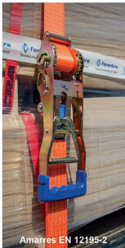
Amarres EN 12195-2