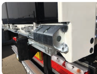
Angolari di protezione