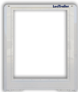
Parete anteriore: struttura monoblocco galvanizzata e in cataforesi KTL