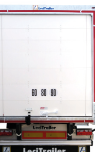
Porta a serranda