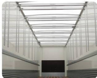
Opzione doppio piano e tetto in poliestere.