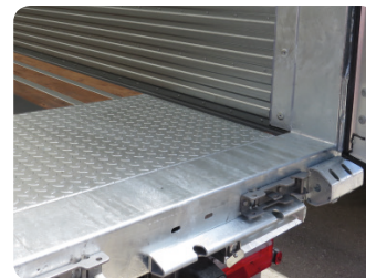
Lamiera di protezione per accesso carrelli