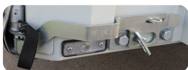
Tendeur avant quart de tour