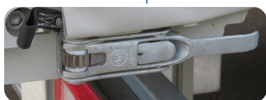
Tendeur arrière cliquet enrouleur