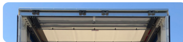
Traverse arrière embarquée

› Freins à tambour. › Passage latéral de charge jusqu'à 3.000 mm. › Roue de secours. › Pneus dimensions 385/55 R 22.5. › Compteur kilométrique. › Signal acoustique de marche arrière. › Bidon d'eau de 30 litres. › 3 ème feux stop. › Plancher Kapur ou Multipli. › Profil d'arrimage multilocks.