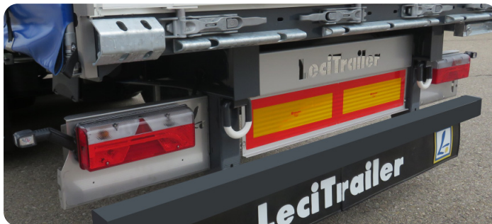
Protection et finition arrière