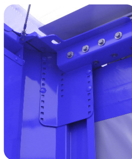
Fixation face avant / latéral