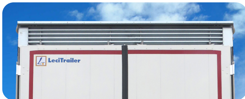
Trave tetto porte dietro multipunto