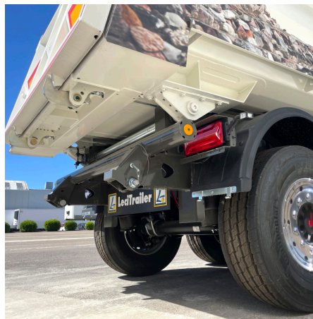
Paragolpes abatible y protecciones para asfalto