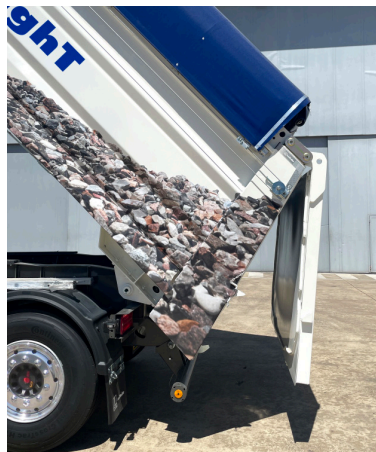
Puerta de apertura vertical de doble giro