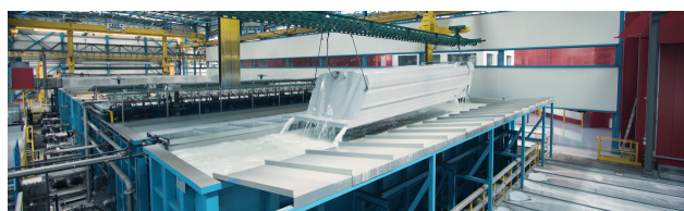
KLT: Protección anti corrosión en chasis y caja por cataforesis