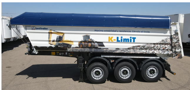
Diseño compacto, excelente maniobrabilidad