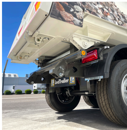
Paragolpes abatible y protecciones para asfalto