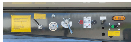
Suspensión de tres posiciones y ayuda a la tracción