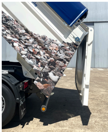
Puerta de apertura vertical de doble giro